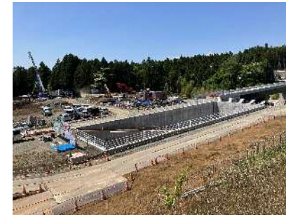
②上野川橋左岸調整池