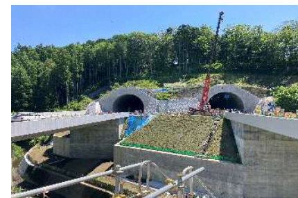
①西側トンネル坑口