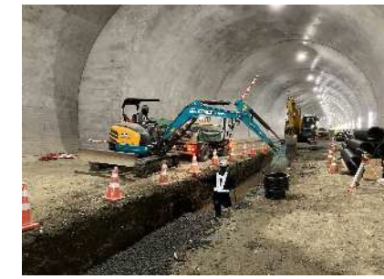
③下り線トンネル中央排水工