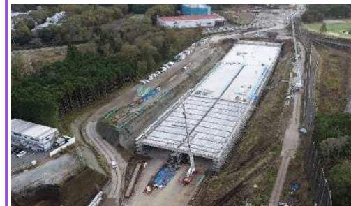
ボックスカルバートの頂版を施工中