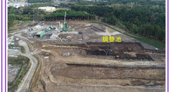
調整池の掘削状況