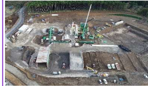
仮設のアスファルトプラントを建設中