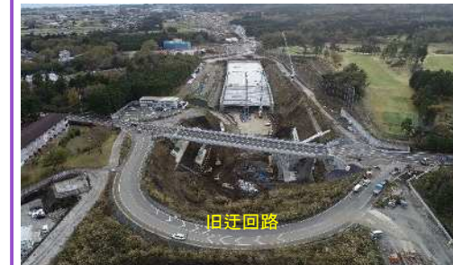
本線(旧迂回路部)の掘削を開始します。