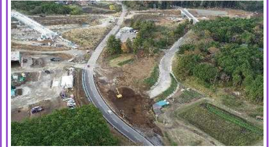
町道交差点部の掘削状況。