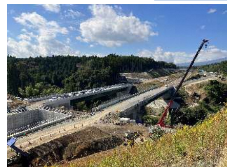
②上野川橋~名古屋側