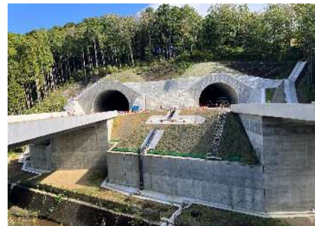
①西側トンネル坑口