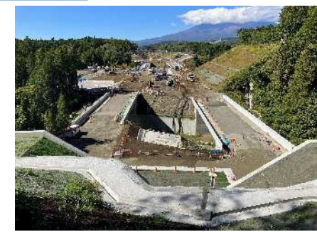
③トンネル西坑口~名古屋側