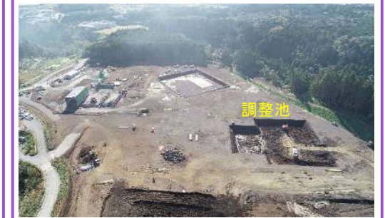
調整池の掘削を開始しました。