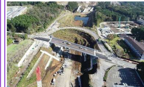
新設道路への切替を行いました。