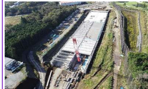
ボックスカルバートの頂版を施工中