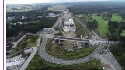
新設道路への切替に向けて工事を進めております。