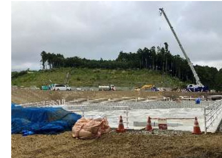
③奥の沢川右岸調整池