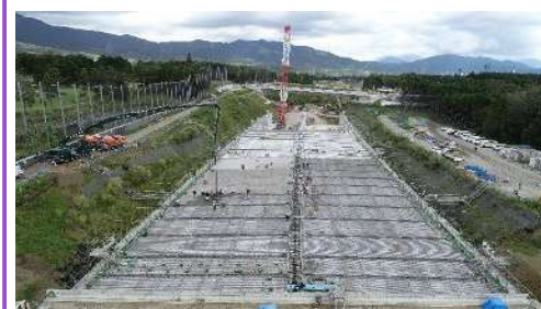
ボックスカルバートの頂版を施工中