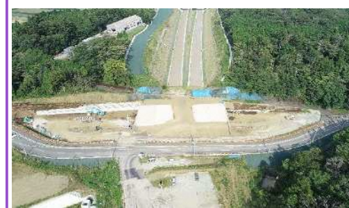
大型ブロック積を施工中