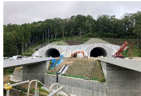
①西側トンネル坑口