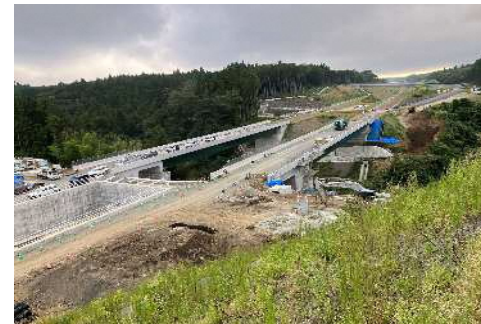
②上野川橋～名古屋側