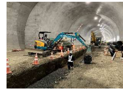
③下り線トンネル中央排水工