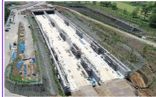
ボックスカルバートの壁を構築中