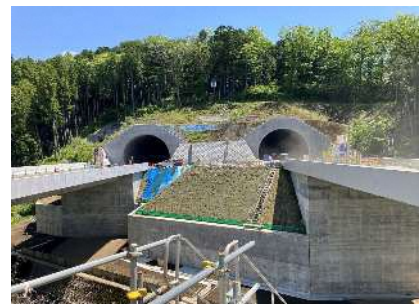
①西側トンネル坑口