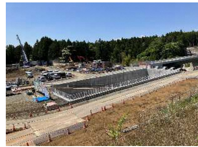
②上野川橋左岸調整池