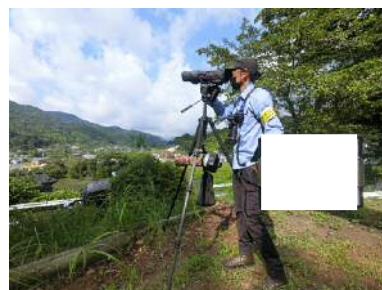
動植物調査の様子

○その他：調査にあたっては、身分証明書を携帯し、また調査員であることを示す腕章を着用いたします。また、駐車車両には、調査用車両と分かるように表示いたします。