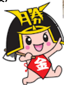
勝央町マスコットキャラクター きんとくん