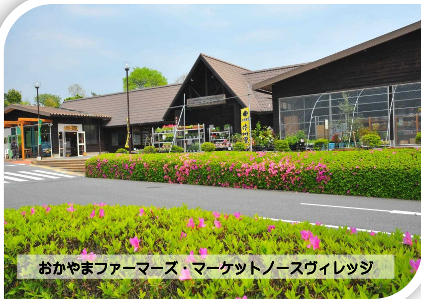
おかやまファーマーズ・マーケットノースヴィレッジ