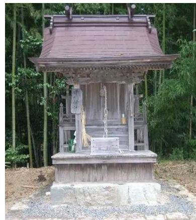
金太郎の眠る社 (栗柄神社)