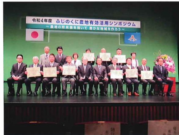
【写真】令和4年度ふじのくに農地有効活用シンポジウムにて小山町農業委員会が「優良賞」を受賞

この度、小山町農業委員会が実施した「秘密の花園作戦」が「優良賞」を受賞しました。