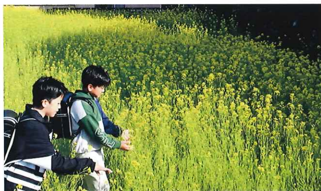
【写真】秘密の花園の様子（下谷）